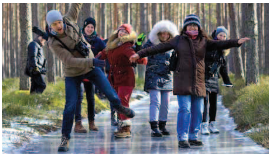
Putnu mācības un slidināšanās pie Engures ezera.

ieinteresēja piedāvājums, jo pēc izglītības esmu vides inženiere un tieši tajā laikā meklēju kārtējo dzīves izaicinājumu. Protams, jo vairāk es darbojos savā specialitātē, jo vairāk man radās jautājumu par putniem, to uzvedību, klātbūtnes iemesliem un citām svarīgām lietām, kuras ietekmē lidojumu drošību. Patstāvīgi mācīties atpazīt putnu sugas bija diezgan grūti, man vieglāk šķiet apmeklēt kursus un mācīties pie profesionāļiem. Daudz zināšanu esmu smēlusies no savas kolēģes Dzintras Guļānes, kas bija pirmā putnu un citu dzīvnieku kontroles speciāliste Starptautiskajā lidostā “Rīga”, bet ar to nepietika. Meklējumi aizveda mani uz LOB interneta vietni, kur arī uzzināju par teorētiskajiem un praktiskajiem putnu noteikšanas kursiem. 2016. gadā esmu bijusi dalībniece teorētiskajosursos un šogad uzdrīkstējos pieņemt putnu noteikšanas lauka kursus. No desmit piedāvātajām sesijām biju izvēlējusies septiņas. Kurss sākās marta beigās un noslēdzās jūlija sākumā, tas ļāva apmācāmajiem