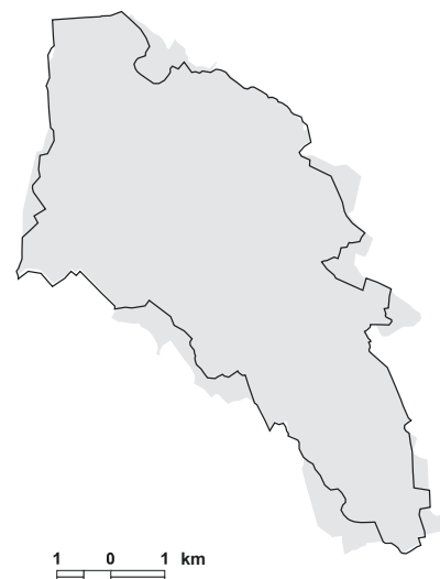
5.28. attēls. Putniem nozīmīgās vietas LV033 Lielais un Pemmas purvi robežu izmaiņas, salīdzinot ar vietas robežām iepriekšējā PNV pārskatā [1].