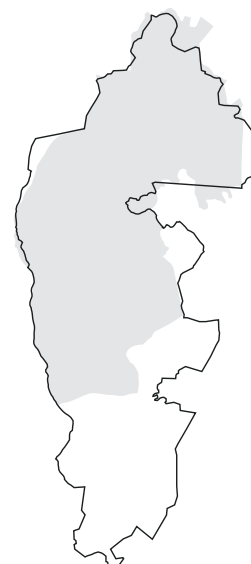
5.29. attēls. Putniem nozīmīgās vietas LV035 Augstroze robežu izmaiņas, salīdzinot ar vietas 035 Madiešēnu purvs robežām iepriekšējā PNV pārskatā [1].