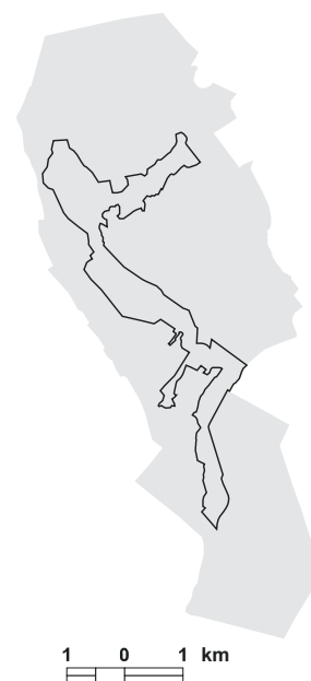
5.31. attēls. Putniem nozīmīgās vietas LV037 Rūjas paliene robežu izmaiņas, salīdzinot ar vietas 037 Rūjas zivju dīķi robežām iepriekšējā PNV pārskatā [1].