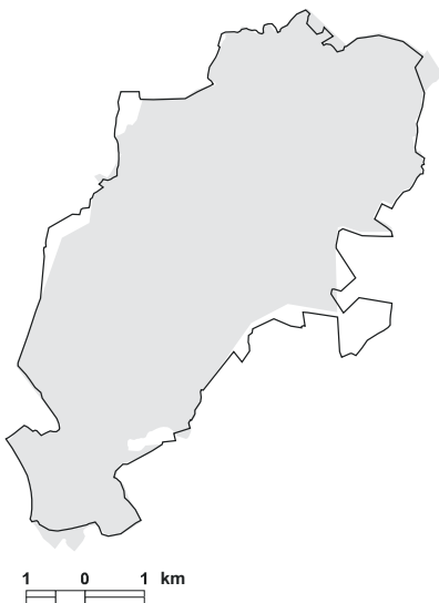
5.37. attēls. Putniem nozīmīgās vietas LV057 Orlovas purvs robežu izmaiņas, salīdzinot ar vietas robežām iepriekšējā PNV pārskatā [1].