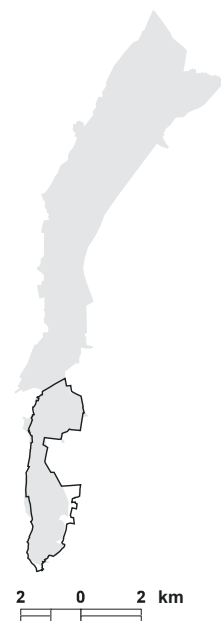
5.6. attēls. Putniem nozīmīgās vietas LV008 Uzaņas augštece robežu izmaiņas, salīdzinot ar vietas robežām iepriekšējā PNV pārskatā [1].