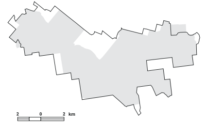
5.10. attēls. Putniem nozīmīgās vietas LV016 Stikli robežu izmaiņas, salīdzinot ar vietas robežām iepriekšējā PNV pārskatā [1].