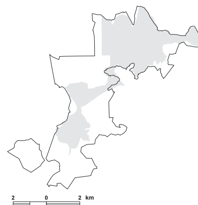
5.14. attēls. Putniem nozīmīgās vietas LV023 Sātiņu zivju dīķi robežu izmaiņas, salīdzinot ar vietas robežām iepriekšējā PNV pārskatā [1].