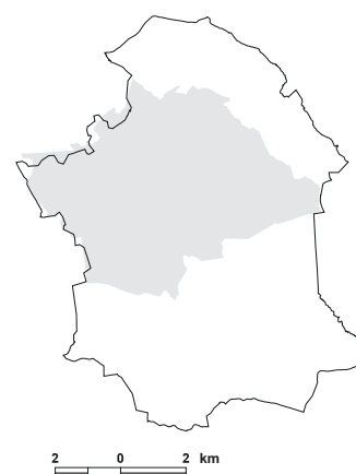
5.15. attēls. Putniem nozīmīgās vietas LV024 Zvārdes meži robežu izmaiņas, salīdzinot ar vietas robežām iepriekšējā PNV pārskatā [1].