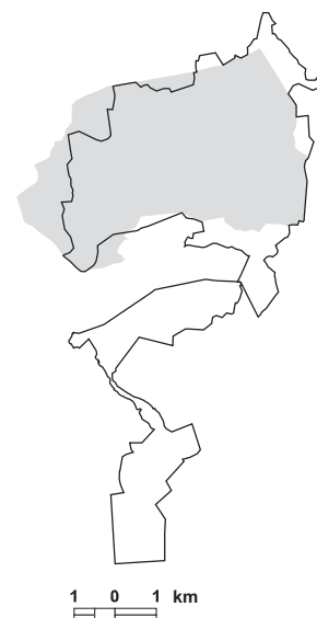
5.16. attēls. Putniem nozīmīgās vietas LV066 Stūru un Zvārdes purvi robežu izmaiņas, salīdzinot ar vietas robežām iepriekšējā PNV pārskatā [1].