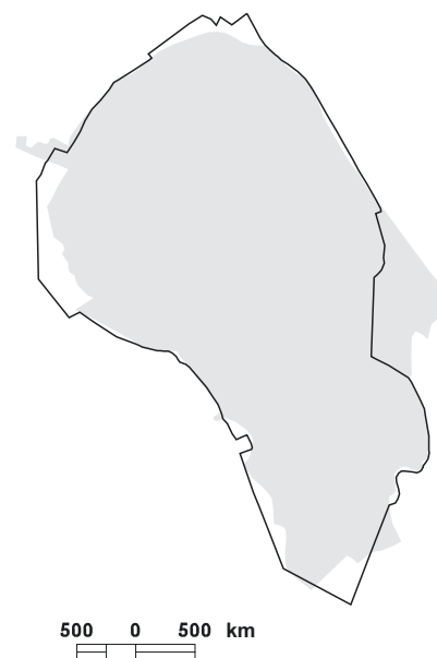
5.17. attēls. Putniem nozīmīgās vietas LV025 Lielaucis ezers robežu izmaiņas, salīdzinot ar vietas robežām iepriekšējā PNV pārskatā [1].